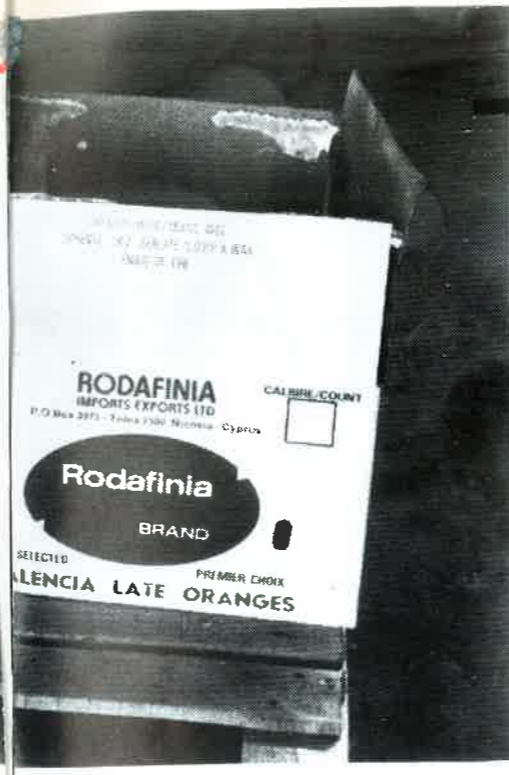
Σε τέτοια κιβώτια βρέθηκε το χασίς.